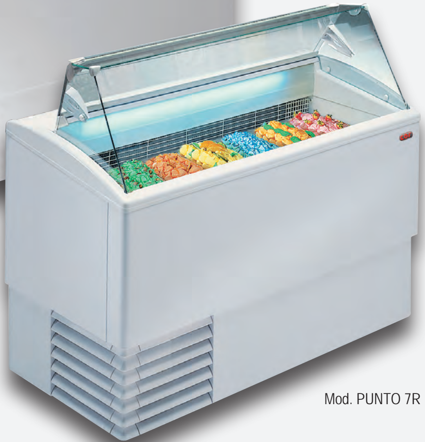
Mod. PUNTO 7R