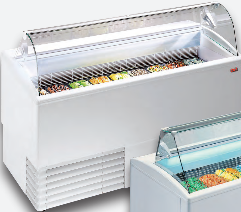
Mod. PUNTO 9 RS