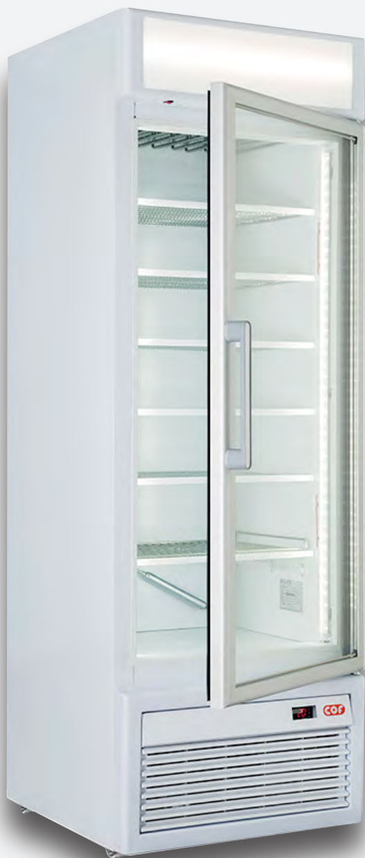
Mod. TAURUS 40 RS TB