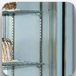
Estantes regulables en altura (Mod.estático)