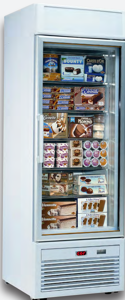
Mod. TAURUS 50 RV TB